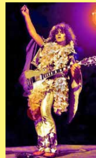
Marc Bolan dei T-REX

Marc Bolan e i suoi T-REX, DAVID BOWIE, ROXY