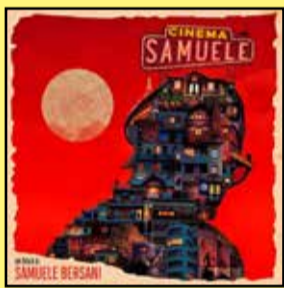
La copertina del disco di Samuele Bersani

- Tra le dieci canzoni scelte da Amnesty International e Voci per la Libertà come candidate per il 2021 al "Premio Amnesty International Italia", c'è anche "Le Abbagnale" di Samuele Bersani. Il brano è tratto dal disco "Cinema Samuele" già fresco di nomina come "Il miglior album italiano 2020". Complimenti Samuele!