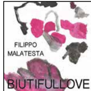
Filippo Malatesta La copertina del disco

ne Puglia: "E allora amore / Giulia andiamo in Puglia", canta infatti il cantautore nel ritornello e la title track "Biutifullove" è un brano che parla di un amore impossibile, di sensazioni nelle quali chiunque abbia vissuto una difficile storia d'amore può ritrovarsi. "Bellissimo amore, amore impossibile": inizia così la canzone.