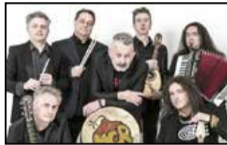
Modena City Ramblers

- Nel corso degli anni sono tanti gli artisti schierati con le loro note e parole a favore dell'ambiente. Qui tracciamo una playlist green con alcune delle canzoni più famose per riflettere insieme sulla necessità di modificare il nostro atteggiamento nei confronti del pianeta, per poter ancora beneficiare delle bellezze che la nostra Terra giornalmente ci regala.