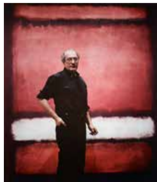
Mark Rothko davanti ad una sua opera

La mostra "Mark Rothko a Firenze", allestita a Palazzo Strozzi e inaugurata il 14 marzo scorso, resterà aperta fino al 28 agosto.